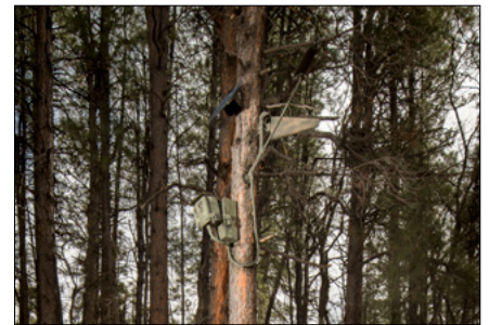
Unidad de Flowtography adjunta a un árbol

Si por alguna razón tienes problemas para pagar tu factura, por favor comunícate con nosotros de inmediato. SRP tiene programas de ayuda, como el Plan de Precio Económico. Clientes elegibles pueden recibir un descuento de $23 mensual durante el año que se aplicará como un crédito a la cuenta. Para obtener más información sobre el plan, elegibilidad e inscripciones, visita misrp.com/ayuda , o llama al (602) 236-1111 .